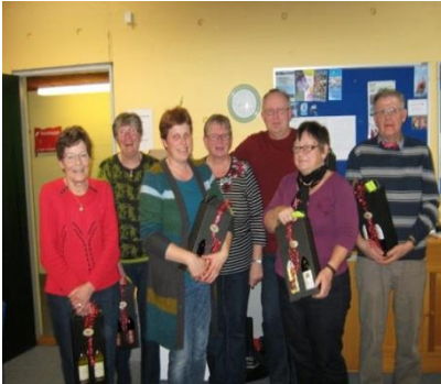
Unge for Ligeværd (UFL) Vestjylland