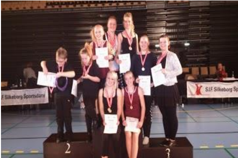
Rockróll formationsholdet Struer Sportsdanserforening