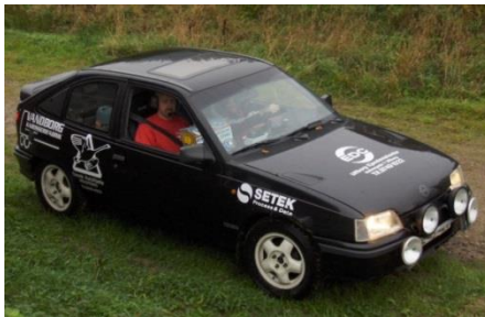
Jørn Mørup Struer & Omegns Motorsport