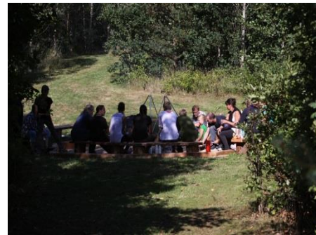
Ledergruppen, Struer Spejderne