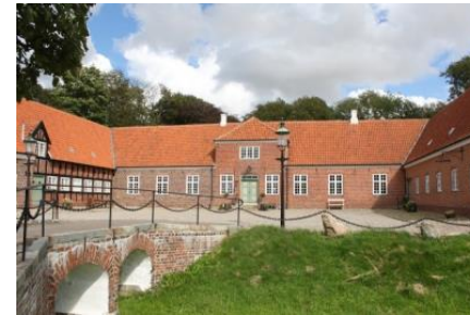
Ausumgårds kulturelle tiltag