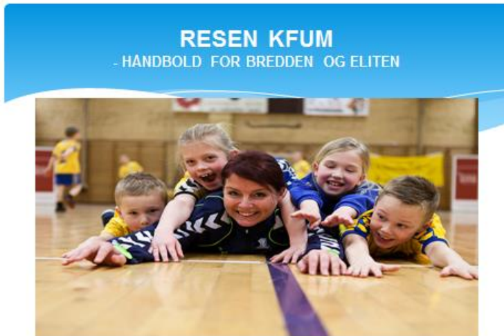
Resen KFUM Håndbold