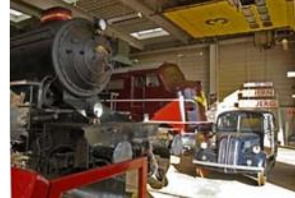
Støtteforeningen for Struer Jernbanemuseum