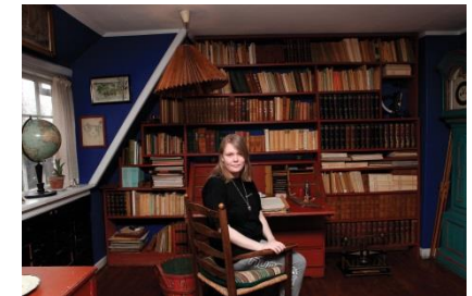
Struer Museum, som praktiksted for handicappede